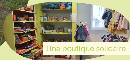
Une boutique solidaire