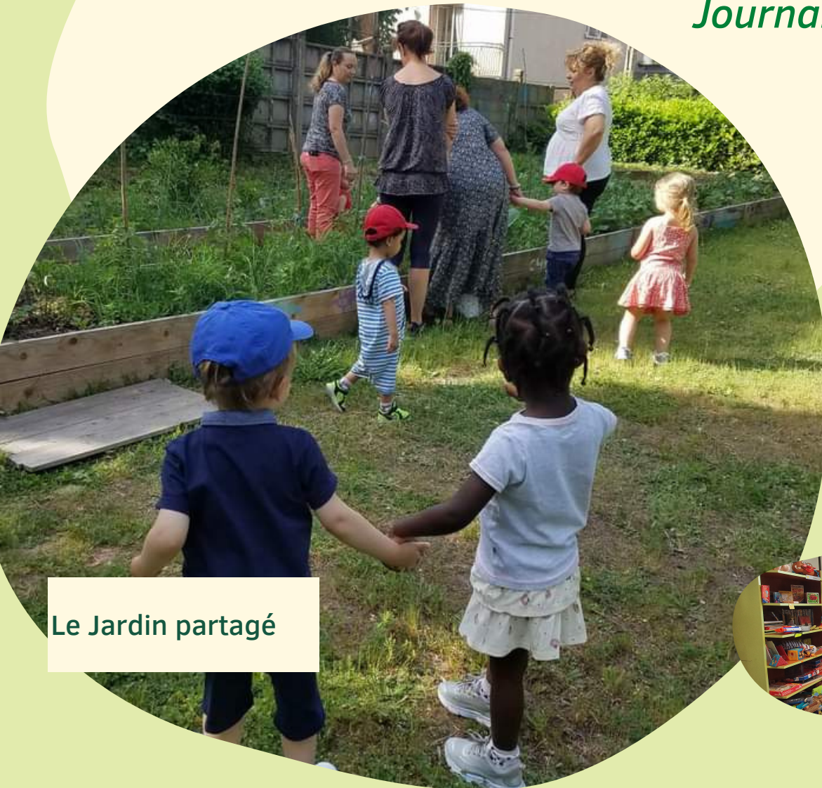
Le Jardin partagé